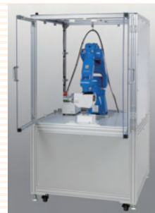
硬さムラ測定装置 muraR ロボットシステム