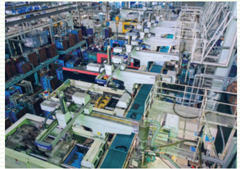
ずらっと並んだ成形機

軽いプラスチックを用い、更なる軽量化を実現する為、金属代替・発泡成形+環境に優しいCNFを使った材料でのTRYなど、新たなチャレンジをしています。